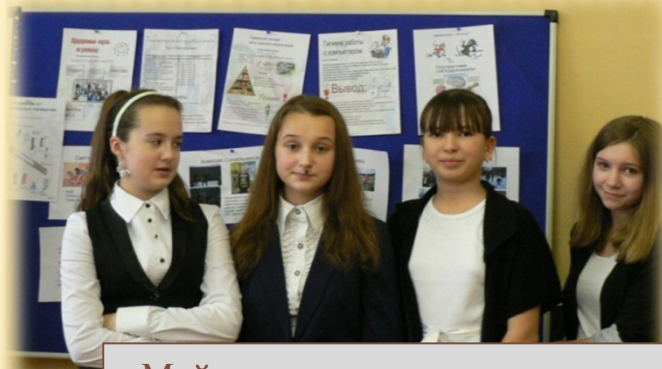
«Мой рацион питания» конкурс плакатов, 7 б класс