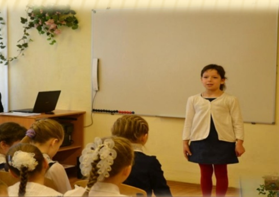
«Питание витаминов» классный час, 2а класс

В школах ведется работа по пропаганде здорового питания школьников. Во всех образовательных учреждениях оформлены стенды с информацией для родителей об организации питания и по пропаганде здорового питания. В течение учебного года было организовано обучение школьников навыкам здорового питания через образовательный процесс и самостоятельную работу. В школах проводились родительские собрания по привлечению родителей в вопросах здорового питания. В школах работают службы здоровья.